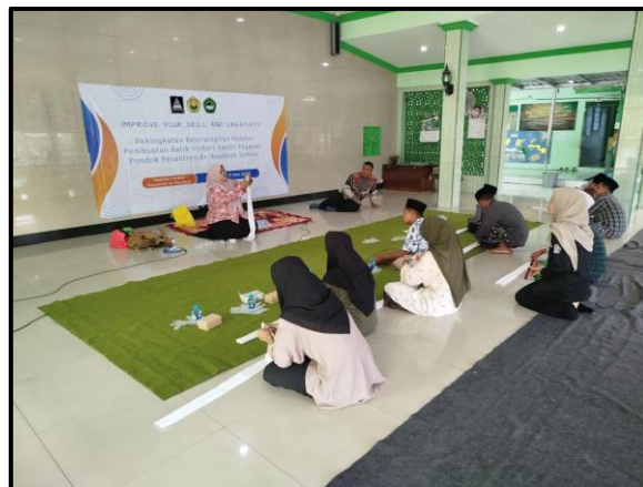
Gambar 3. Pelatih memberikan instruksi praktek membuat batik shibori