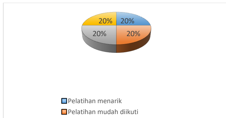
Gambar 6. Hasil Evaluasi Pelatihan Pembuatan Batik Shibori