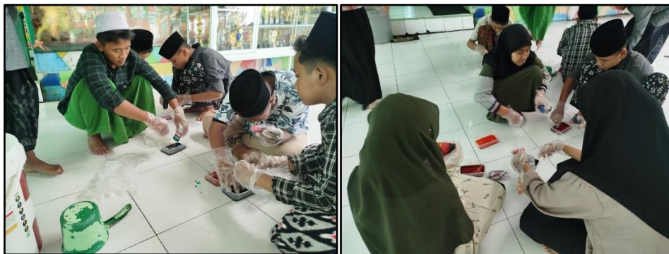
Gambar 4 Dan 5. Proses Pembuatan Kreasi Batik Shibori

Strategi pelatihan yang diterapkan pada pelatihan batik Shibori memberi gambaran bahwa strategi pembelajaran yang berpusat pada peserta belajar (Rahman, M.A., Hilmi, M.I., 2021). Evaluasi yang dilakukan kepada warga belajar meliputi aspek kognitif, afektif, dan psikomotor. Kegiatan evaluasi yang dilakukan oleh Tim Pengabdian sebagai sumber belajar dan hasilnya sudah cukup baik artinya dilakukan ketiga aspek, yaitu pengetahuan, sikap, dan psikomotor terhadap pemahaman dan penerapan hasil pelatihan kerajinan. Pelaksanaan penilaian proses sesuai dengan pendapat Sudjana (2018) yang mengemukakan bahwa evaluasi terhadap proses kegiatan pembelajaran diarahkan untuk mendiagnosis tingkat kesesuaian antara kebutuhan belajar dan rencana kegiatan pembelajaran dengan pelaksanaan pembelajaran dalam menjembatani jarak atau perbedaan antara kemampuan saat ini dengan kemampuan yang diinginkan. Instruktur memberi materi tata cara pembuatan batik shibori, yaitu terkait alat dan bahan yang harus disediakan dan cara pengerjaan. Pelatih mendemonstrasikan terkait cara pengerjaan pembuatan batik shibori dengan bahan yang telah disediakan, peserta pelatihan memperhatikan dengan seksama. Selanjutnya para santri Yayasan Pondok Pesantren Ar-Roudhoh membuat beberapa kreasi motif batik shibori.