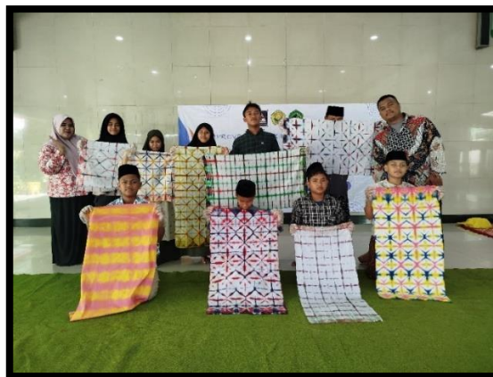
Gambar 4. Hasil Kreasi Batik Shibori

Kegiatan pelatihan ini dilakukan secara praktek 80% dan 20 % teori, sehingga proses pemahaman dan pengetahuannya dapat diimplementasikan dalam pekerjaannya. Metode dan teknik pembelajaran dalam kegiatan pelatihan batik shibori berupa tanya jawab, curah pendapat, diskusi, demonstrasi, simulasi, praktek, penugasan. Penentuan metode pembelajaran tersebut disesuaikan dengan kebutuhannya. Pemilihan metode dan teknis tersebut didasarkan pertimbangan bahwa dalam pembelajaran ini dimaksudkan untuk memberi dorongan, menumbuhkan minat belajar, menciptakan iklim belajar yang kondusif, menambah energi untuk melahirkan kreativitas batik Shibori (Hilmi, 2019), mendorong untuk menilai diri sendiri dalam proses dan hasil belajar, serta mendorong dalam melengkapi kelemahan hasil belajar (Abdulhak, 2018).