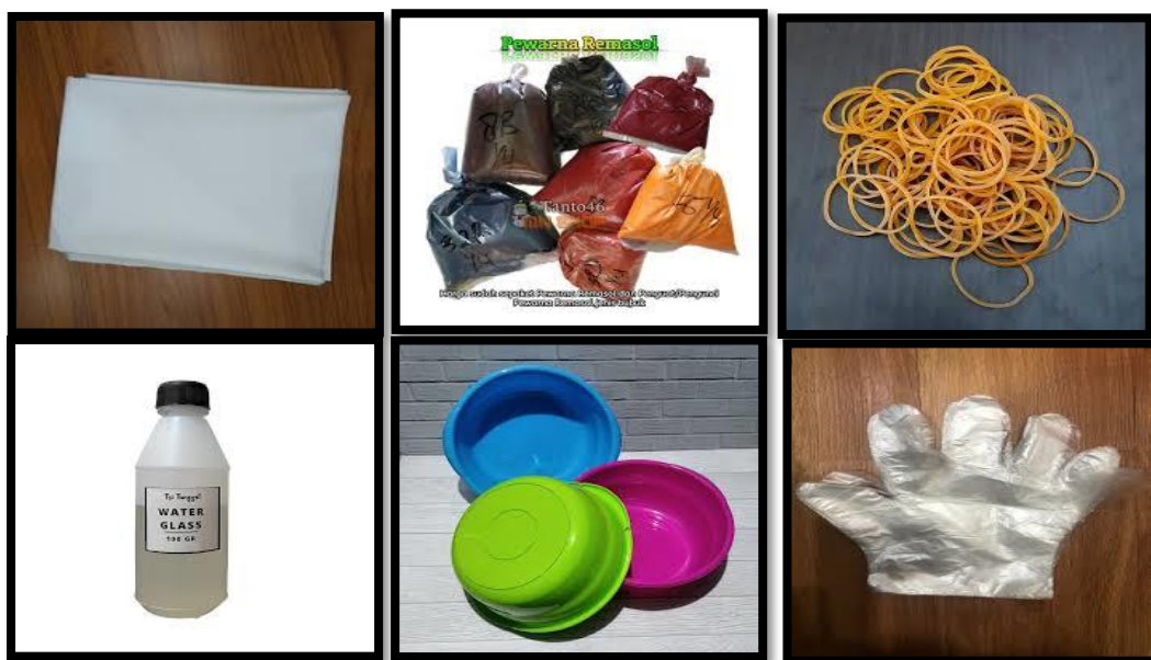
Gambar 2. Alat dan Bahan Pelatihan Batik Shibori

Peserta dalam kegiatan ini adalah santri Yayasan Pondok Pesantren Ar-Roudhoh Kabupaten Jember sebanyak 10 orang. Berdasarkan evaluasi, para peserta sangat antusias dalam mengikuti kegiatan ini, karena materi-materi tentang membuat batik shibori belum pernah mereka dapatkan dan memiliki nilai manfaat untuk kehidupan sehari-hari. Karena itulah tim pengabdian ini berusaha menyajikan materi dengan semenarik mungkin agar suasana tidak menegangkan. Berikut alat dan bahan yang digunakan dalam pelatihan membuat batik shibori dalam pengabdian ini: