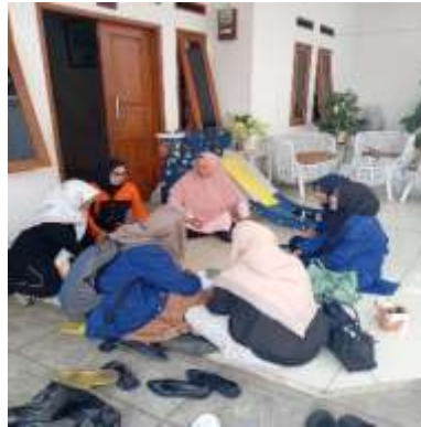
Gambar 2. Sosialisasi Program Kang Fisman Kepada Warga

Kelurahan Cipamokolan, meski masih perlu ditingkatkan untuk mencapai target pengurangan sampah yang lebih optimal. Hasil ini sejalan dengan penelitian Yuanita (2020) bahwa edukasi langsung dan fasilitas pendukung mampu meningkatkan partisipasi pemilahan. Namun capaian di Cipamokolan masih lebih rendah (26, 64%) dibandingkan studi di Sukaluyu yang mencapai > 40% partisipasi menunjukkan perlunya strategi. (Yunita at al, 2022).