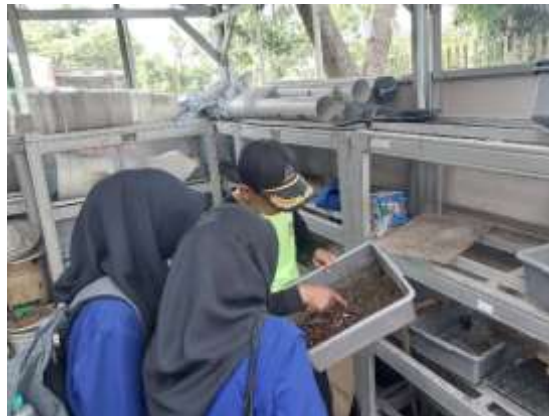
Gambar 3. Survei Rumah Maggot