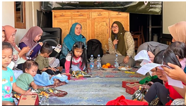
Gambar 1. Kegiatan Program Pengabdian

Untuk memastikan keberlanjutan dampak program, tim melaksanakan evaluasi melalui kuesioner dan diskusi reflektif, kemudian melakukan monitoring terhadap peningkatan keterlibatan perempuan di musyawarah desa. Selain evaluasi jangka pendek, program ini juga menekankan pemantauan jangka panjang, seperti terbentuknya komunitas advokasi perempuan desa dan perubahan kebijakan desa yang lebih responsif gender.