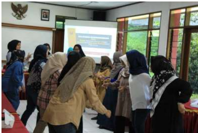
Gambar 3. Membangun suasana pelatihan yang menyenangkan