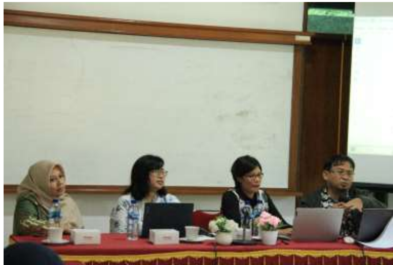
Gambar 2. Kegiatan pelatihan KPM PKH