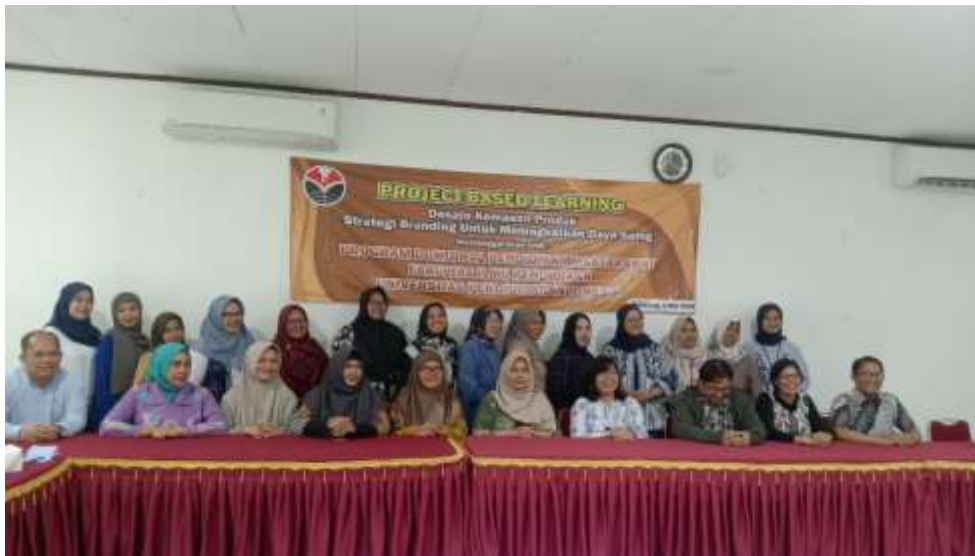
Gambar 4. Penutupan Kegiatan

Penyusunan laporan dilakukan dengan pada tahap akhir kegiatan. Beberapa kegiatan yang dilakukan di dalam tahap ini adalah menyusun hasil kegiatan dalam bentuk artikel untuk dipresentasikan pada forum ilmiah nasional dan juga publikasi pada jurnal terindeks nasional, dan juga mengirimkan produk kegiatan berupa laporan hasil kegiatan ke lembaga pengelola hak kekayaan intelektual untuk mendapatkan HAKI.