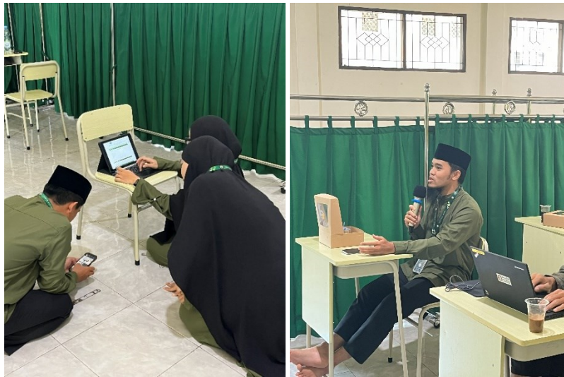
Gambar 2. Peserta Mengerjakan Tugas secara Individu dan Kelompok

Kegiatan terakhir dari pelatihan ini adalah pelaksanaan post-test untuk mengukur pemahaman peserta setelah mengikuti seluruh rangkaian materi pelatihan. Post-test ini berfungsi untuk menilai sejauh mana peserta dapat mengaplikasikan pengetahuan yang diperoleh terkait dengan penyusunan instrumen assessment, prinsip deep learning, soal HOTS, serta penggunaan teknologi seperti Kahoot dan Quizizz. Setelah post-test, dilakukan juga evaluasi kegiatan pelatihan untuk mengumpulkan umpan balik peserta mengenai kualitas materi dan metode pelatihan. Hasil dari post-test dapat dilihat pada tabel berikut: