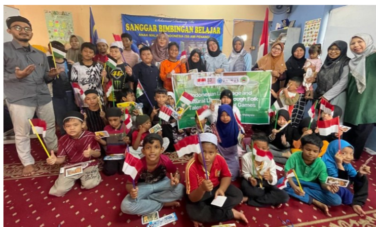
Gambar 1. Sanggar Bimbingan AMI Penang

Sanggar Bimbingan AMI Penang yang berlokasi di Bukit Mertajam, Pulau Pinang, merupakan salah satu bentuk layanan pendidikan nonformal yang dibangun oleh komunitas diaspora untuk menjembatani kebutuhan belajar anak-anak Indonesia. Sanggar ini melayani sekitar 20 anak yang terbagi dalam tiga kelas, yaitu taman kanak-kanak, literasi dasar, dan aritmatika dasar. Hasil observasi dan diskusi awal bersama pengelola sanggar menunjukkan adanya kesenjangan tingkat kemampuan akademik, terutama pada keterampilan membaca dan berhitung. Beberapa anak yang secara usia seharusnya berada pada jenjang lebih tinggi masih menunjukkan kemampuan setara kelas rendah. Temuan ini sejalan dengan hasil pengabdian dan penelitian sebelumnya yang menyebutkan bahwa anak-anak migran cenderung mengalami learning loss akibat keterputusan jenjang pendidikan dan minimnya pendampingan belajar yang berkesinambungan (Muthmainnah & Rohmah, 2022); (Jo Kelcey, 2022).