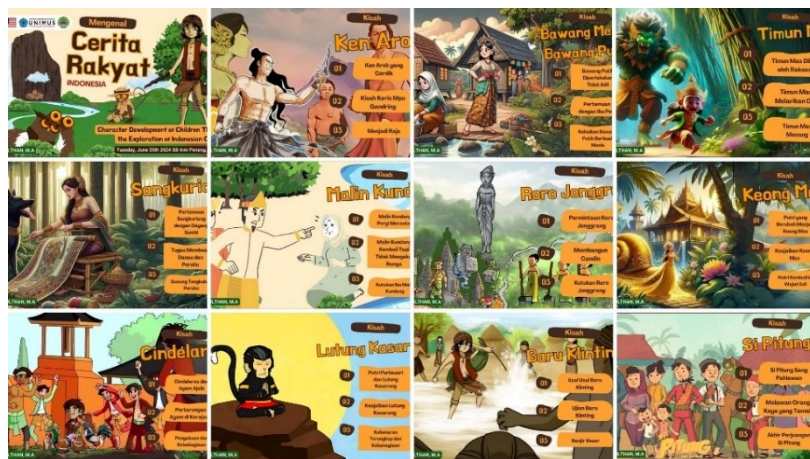
Gambar 5. Flashcard Visual 11 Cerita Rakyat

Pemanfaatan Reading Box Area sebagai bagian dari intervensi juga memberikan kontribusi positif terhadap dinamika pembelajaran. Fasilitas ini memungkinkan pelaksanaan sesi membaca kolaboratif yang lebih terstruktur dan interaktif. Ketersediaan buku bertema budaya, flashcard visual, serta katalog sederhana membantu anak dalam memilih bacaan dan memudahkan pembimbing mengelola aktivitas membaca. Temuan ini memperkuat hasil pengabdian sebelumnya yang menunjukkan bahwa sudut baca komunitas mampu meningkatkan frekuensi interaksi anak dengan bahan bacaan dan mendorong pembelajaran berbasis kolaborasi, terutama pada lingkungan dengan keterbatasan sarana pendidikan formal (Nabilla et al., 2025); (Triristina et al., 2025).