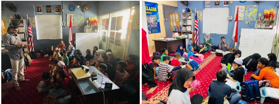
Gambar 2. Promosi Minat Baca Melalui Reading Box Area , Flashcard , Dan Katalog Bacaan

Kegiatan melibatkan 25 peserta (TK-SD) yang dikelompokkan secara fleksibel berdasarkan tingkat kemampuan awal, bukan semata usia. Pada kelompok TK, fokus diarahkan pada pengenalan kosakata, bunyi huruf, dan pemahaman cerita melalui gambar. Pada kelompok SD, pendampingan menekankan membaca nyaring, menulis jawaban singkat, serta operasi hitung dasar yang diambil dari konteks cerita.