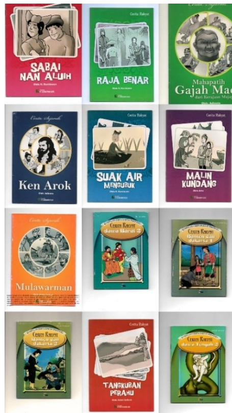
Gambar 4. Buku-Buku Cerita Rakyat Indonesia yang Ada di Area Box

katalog sederhana yang memudahkan peserta didik memilih bahan bacaan secara mandiri, menumbuhkan minat baca, dan secara berkelanjutan memperkuat pelaksanaan program literasi di Sanggar Bimbingan AMI Penang.