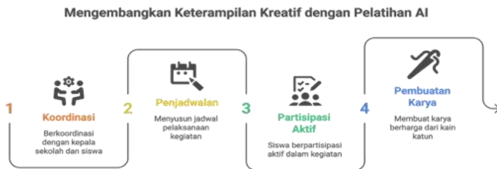
Gambar 3. Mengembangkan Keterampilan Kreatif dengan Pelatihan AI

Kepuasan peserta yang tinggi (82,9%) dan rencana penerapan yang konkret (74,3%) menunjukkan bahwa program ini tidak hanya meningkatkan pengetahuan dan keterampilan, tetapi juga memotivasi peserta untuk terus belajar dan menerapkan AI dalam konteks mereka sendiri. Ini sejalan dengan teori pelatihan yang menekankan bahwa keberhasilan pelatihan diukur tidak hanya dari transfer pengetahuan, tetapi juga dari motivasi peserta untuk menerapkan pembelajaran dalam praktik (Paigude et al., 2023).