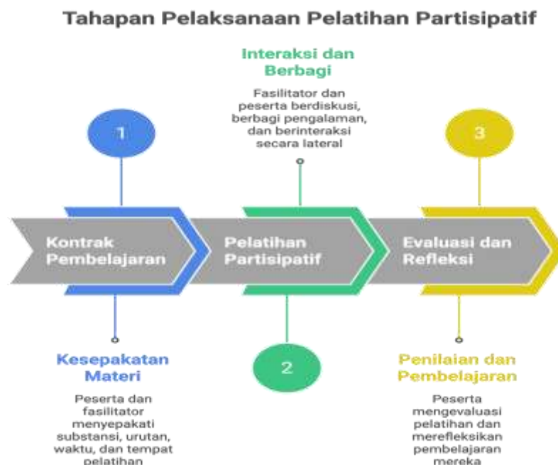
Gambar 2. Tahapan Pelaksanaan Pelatihan Partisipatif

Analisis data dilakukan secara kuantitatif dan kualitatif. Untuk data kuantitatif, peningkatan pengetahuan dianalisis dengan menghitung skor pre-test dan post-test, kemudian menghitung persentase peningkatan individual dan rata-rata kelompok menggunakan rumus: \text{Peningkatan} = (\text{Skor Post-test} - \text{Skor Pre-test}) / \text{Skor Pre-test} \times 100\% . Signifikansi peningkatan diuji menggunakan paired t-test dengan rumus t = \frac{\bar{d}}{s_d/\sqrt{n}} dimana \bar{d} adalah rata-rata perbedaan, s_d adalah standar deviasi perbedaan, dan n adalah jumlah peserta. Data partisipasi dan kepuasan dianalisis dengan menghitung persentase dan rata-rata skor untuk setiap indikator. Untuk data kualitatif, respons peserta dalam lembar refleksi dianalisis melalui coding berbasis tema (pemahaman AI, rencana penerapan, tantangan, saran), mengidentifikasi pola dan tren dalam feedback, serta mengekstrak kutipan representatif. Observasi kualitatif didokumentasikan untuk mengidentifikasi momen pembelajaran signifikan, hambatan yang dihadapi, dan perubahan perilaku peserta sepanjang program. Analisis proyek kelompok menggunakan rubrik yang telah ditetapkan untuk mengevaluasi kreativitas, relevansi solusi, dan kedalaman pemahaman AI yang ditunjukkan peserta.