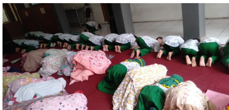
Gambar 3 Kegiatan Pembiasaan Salat Duha Berjamaah Setelah Menonton Video Pembelajaran Salat