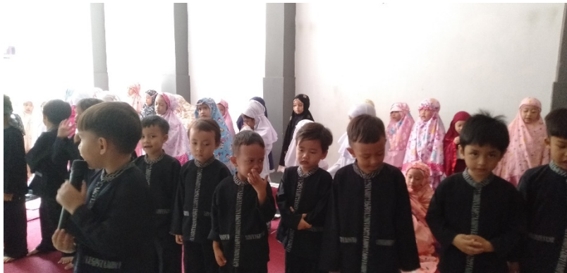
Gambar 1 Kegiatan Anak Melaksanakan Pembiasaan Salat Duha Berjamaah

Oleh karena itu strategi yang dilakukan oleh guru RA Ar-Rahmi sangat tepat dimana aturan perlu dibuat dan disepakati di awal pembiasaan agar anak lambat laun dapat mengikutinya, maka aturan-aturan yang telah ditetapkan harus diterapkan secara konsisten oleh semua anak agar anak dapat terbiasa menjadikan suatu pelajaran yang berharga dan mereka dapat menerima disiplin tersebut dan menjadi suatu kebiasaan. Dapat dilihat dari pada gambar 2, dimana anak sedang melakukan pembiasaan salat duha berjamaah.