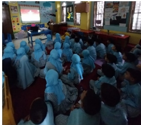
Gambar 2 Kegiatan Menonton Video Pembelajaran Salat