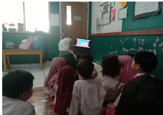
Gambar 1. Penjelasan Terkait Penggunaan Media Video Animasi

Kegiatan penelitian minggu pertama dilakukan pada hari senin 12 februari 2024 sampai dengan hari kamis, 16 Februari yang dilakukan pada jam 08.00-10.00 WIB dengan tema pekerjaan mulai dari pertemuan pertama hingga pertemuan ke empat. Diawal kegiatan anak-anak terbiasa melakukan senam, baris-berbaris, bewudhu, sholat dhuha, berdoa, dan awal guru bertanya tentang kabar anak, menabsen kehadiran anak, dan menanyakan hari, tanggal dan tahun secara bergantian satu- persatu kepada anak, dan sebelum pembelajaran menggunakan media video animasi, guru memberikan penjelasan terkait penggunaan media tersebut.