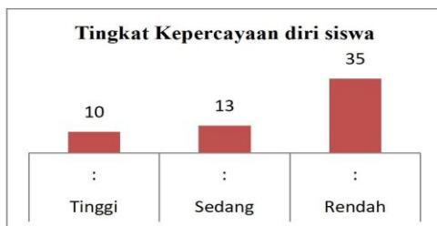
Grafik 1. Tingkat kepercayaan diri siswa

Grafik di bawah ini menunjukkan hasil analisis tingkat kepercayaan diri siswa di Sekolah Dasar Negeri Gadang 4 Kota Malang dalam mengikuti pembelajaran Pendidikan Pancasila. Data diperoleh melalui observasi dan pengisian instrumen penilaian yang mencakup beberapa indikator, seperti keyakinan terhadap kemampuan diri, sikap optimis, objektivitas, tanggung jawab, dan rasionalitas dalam belajar. Grafik ini menggambarkan persebaran jumlah siswa berdasarkan kategori tingkat kepercayaan diri yang terdiri dari tinggi, sedang, dan rendah.