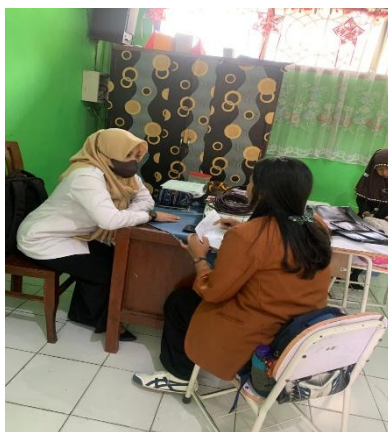
Gambar 1. Saat peneliti melakukan wawancara

rendah, karena dukungan emosional dari lingkungan keluarga belum sepenuhnya optimal dalam mendorong keberanian anak untuk tampil di depan umum. Lebih lanjut, penelitian empiris oleh Hidayati dan Putra (2023) menegaskan bahwa penggunaan metode pembelajaran aktif dan kolaboratif dapat meningkatkan kepercayaan diri siswa dalam pembelajaran Pendidikan Pancasila. Siswa yang terlibat dalam kegiatan seperti diskusi kelompok, bermain peran, atau studi kasus menunjukkan peningkatan dalam kemampuan berpendapat dan rasa percaya diri. Berdasarkan temuan tersebut, dapat disimpulkan bahwa rendahnya tingkat kepercayaan diri siswa SDN Gadang 4 dapat diatasi melalui strategi pembelajaran yang lebih partisipatif dan berorientasi pada pengalaman langsung. Dengan demikian, guru berperan penting dalam menumbuhkan rasa percaya diri siswa melalui pendekatan yang mendukung, memotivasi, dan memberdayakan setiap individu untuk berani mengekspresikan diri dalam proses belajar.