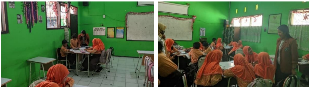
Gambar 2. Saat Peneliti Wawancara dengan Siswa

Sementara itu, pengaruh sosial dan budaya juga menjadi faktor yang tidak dapat diabaikan. Penelitian Lestari dan Wibowo (2021) menunjukkan bahwa norma sosial, budaya sekolah, serta pandangan masyarakat sekitar terhadap keberhasilan individu turut membentuk cara siswa menilai dirinya sendiri. Lingkungan yang menghargai keberagaman dan memberi ruang untuk berekspresi akan menumbuhkan rasa percaya diri yang lebih tinggi. Sebaliknya, budaya kompetitif yang berlebihan atau kebiasaan membandingkan siswa dapat menurunkan rasa percaya diri mereka. Oleh sebab itu, menciptakan budaya sekolah yang inklusif dan mendukung perkembangan setiap individu menjadi langkah penting dalam memperkuat kepercayaan diri siswa secara menyeluruh.