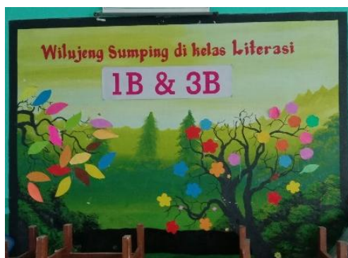
Gambar 3. Pohon Literasi di SDN B

Gambar 3 memperlihatkan tampilan pohon literasi yang ada di kelas 1 dan kelas 3 SDN B. Latar belakang pohon literasi berupa lukisan pemandangan hutan dengan pepohonan. Terlihat bahwa ada dua lukisan pohon yang berwarna hitam, disertai dengan daun-daunan berwarna-warni yang menempel pada pohon literasi. Selain bentuk daun, ada juga bentuk bunga-bunga yang menempel pada pohon literasi. Bunga-bunga dan daun-daun terbuat dari kertas origami yang memiliki banyak warna. Pada bagian atas terdapat kalimat “Wilujeng Sumping di Kelas Literasi” dengan menggunakan font berwarna merah.