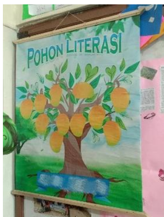
Gambar 1. Pohon Literasi

Dari hasil observasi tentang kondisi pohon literasi, di kelas 1 pohon harapan berbentuk 2 (dua) dimensi, masih terlihat baru, dalam kondisi bersih dan karena pohon harapan terbuat dari bahan banner sehingga pohon harapan terlihat kuat atau tidak mudah rapuh. Karena terdapat tempelan-tempelan daun dari kertas berwarna, sehingga ada beberapa daun yang mulai lepas lem nya. Di kelas 2 pohon literasi dibuat dengan cara dilukis pada dinding belakang kelas. Kondisi pohon literasi terlihat bersih tanpa ada coretan-coretan yang dapat merusak keindahan pohon. Selain itu, pohon literasi di kelas 2 terlihat kokoh karena dilukis sehingga dapat bertahan lama, kecuali guru kelas selanjutnya akan mengganti pohon literasi tersebut. Di kelas 3 pohon komitmen terbuat dari bahan kertas karton dengan bentuk persegi panjang 2 (dua) dimensi. Gambar pohon dibuat menggunakan spidol hitam dan pada ranting-rantingnya terdapat daun-daun dari kertas origami yang menempel pada pohon komitmen. Kondisi pohon komitmen dalam keadaan bersih namun terdapat daun yang warnanya mulai pudar. Di kelas 4 pohon literasi terbuat dari banner berbentuk persegi panjang, dalam kondisi bersih dan terlihat dapat tahan lama.