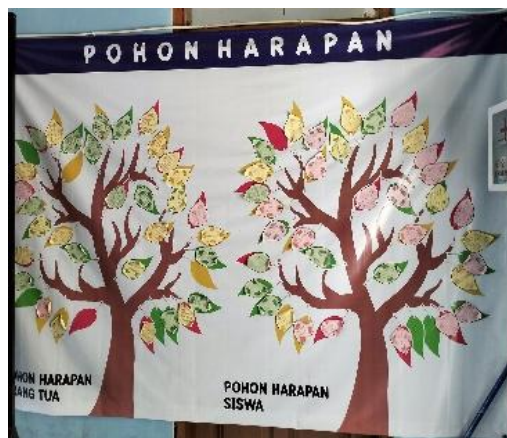
Gambar 2. Pohon Harapan