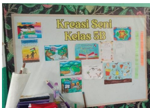
Gambar 4. Tampilan Mading di Kelas 5

Gambar 3 memperlihatkan tampilan pohon literasi yang ada di kelas 1 dan kelas 3 SDN B. Latar belakang pohon literasi berupa lukisan pemandangan hutan dengan pepohonan. Terlihat bahwa ada dua lukisan pohon yang berwarna hitam, disertai dengan daun-daunan berwarna-warni yang menempel pada pohon literasi. Selain bentuk daun, ada juga bentuk bunga-bunga yang menempel pada pohon literasi. Bunga-bunga dan daun-daun terbuat dari kertas origami yang memiliki banyak warna. Pada bagian atas terdapat kalimat “Wilujeng Sumping di Kelas Literasi” dengan menggunakan font berwarna merah.