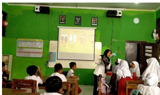
Gambar 1. Penggunaan Media Pop Up

Berdasarkan tabel diatas menunjukan bahwa nilai N-Gain adalah 0,53 maka pengaruh penggunaan media pop up terhadap hasil belajar siswa ada pada kategori sedang.