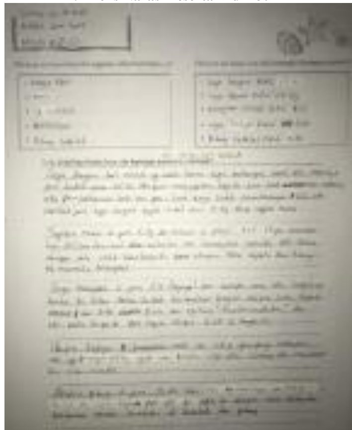
Gambar 2. Teks Narasi Peserta Didik Jumi