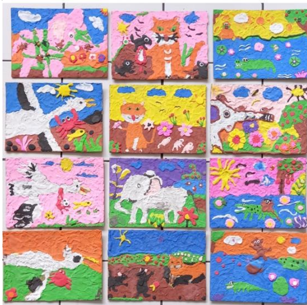
Gambar 3. Hasil Karya Seni Rupa Siswa Membentuk Relief

Selain objek utama yang dibuat secara menonjol, peserta didik juga menciptakan objek-objek pendukung yang sesuai dengan pengalamannya di lingkungan sekitar, misalnya pada cerita buaya yang berada di air dilengkapi dengan bunga teratai. Peserta didik juga menambahkan bentuk objek-objek lain sesuai dengan imajinasi dan kreativitasnya seperti pohon, matahari, awan, bunga, bebatuan dan lain-lain. Warna-warna yang dipilih menunjukkan warna yang lebih natural atau sesuai dengan objek aslinya, seperti daun di pohon menggunakan warna hijau, langit cerah berwarna biru dan langit sore berwarna jingga, walaupun pada sebagian objek pewarnaan masih bersifat subjektif. Penataan ruang telah menggunakan garis horizon, sehingga terlihat garis dasar dan garis langit pada semua karya peserta didik, meskipun belum sepenuhnya memahami konsep perspektif dengan jelas. Berdasarkan keseluruhan hasil karya yang dibuat, peserta didik telah mampu mempraktikkan teknik-teknik dalam berkarya relief plastisin yaitu menggunakan teknik teknik pijit, teknik tempel, dan teknik pilin.