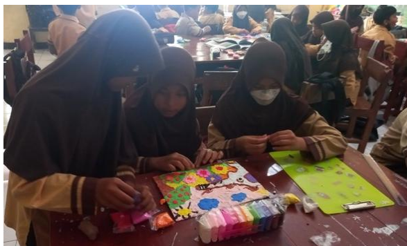
Gambar 2. Kegiatan Berkarya Seni Rupa Membentuk Relief

Berdasarkan sembilan hasil karya relief yang telah dihasilkan oleh peserta didik secara berkelompok menunjukkan kesesuaian dengan teori perkembangan gambar anak menurut Victor Lowenfeld dan Lambert Brittain yaitu tahap realisme awal ( dawning realism ). Seluruh hasil karya relief dapat teridentifikasi objek gambar binatang-binatang yang terdapat di relief candi Mendut diantaranya binatang kucing, tikus, buaya, monyet, burung bangau, kepiting, dan gajah. Hal ini memperkuat bahwa peserta didik menggunakan simbol yang lebih personal dan realistis dengan menggambarkan objek berdasarkan pengamatan mereka. Karya tersebut juga telah menampilkan proporsi ukuran objek utama yaitu binatang yang diceritakan dalam relief candi Mendut dengan lebih menonjol dan menunjukkan komposisi secara sederhana.