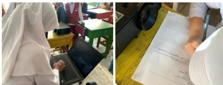
Gambar 2. Pelaksanaan Pembelajaran

Kegiatan mengeksplorasi pada sumber digital yang dipadukan dengan diskusi dan penulisan argumentatif mendorong siswa untuk berpikir lebih dalam serta menyusun alasan dengan logis (Nugraha et al., 2024). Selain itu, peningkatan masalah sosial di era digital memperkuat urgensi guru dalam membekali peserta didik untuk menghadapi arus perubahan yang terus berkembang. Oleh sebab itu, dibutuhkan peran guru sebagai fasilitator dalam membimbing proses eksplorasi informasi digital yang aman dan edukatif.