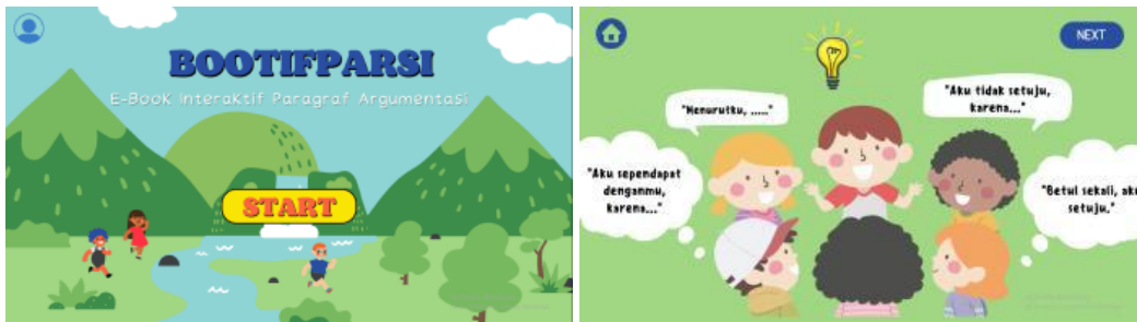
Gambar 1. Tampilan E-book

Pelaksanaan penelitian diawali dengan kegiatan pengenalan paragraf argumentasi menggunakan e-book yang telah peneliti kembangkan. E-book dikembangkan dan telah divalidasi oleh ahli media dan isi konten sehingga dapat digunakan pada mata pelajaran bahasa Indonesia, khususnya pembelajaran menulis paragraf argumentasi. Adapun isi dari e-book ini meliputi definisi, contoh, cara menulis paragraf argumentasi, hingga kuis. E-book ini dikembangkan dengan memanfaatkan fitur-fitur yang menarik untuk siswa seperti gambar animasi, suara, video, serta fitur hyperlink yang interaktif.