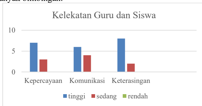
Gambar 1. Kelekatan Guru dan Siswa

Hasil Observasi pola kelekatan guru dan siswa ditemukan bahwa kelekatan guru dalam aspek Kepercayaan, Komunikasi, dan Keterasingan berada pada tingkat yang tinggi. Mayoritas siswa merasa guru memberikan kepercayaan yang tinggi dengan membiarkan mereka menyelesaikan tugas secara mandiri serta memberi tanggung jawab dalam kegiatan kelas. Namun, beberapa siswa masih membutuhkan lebih banyak bimbingan.