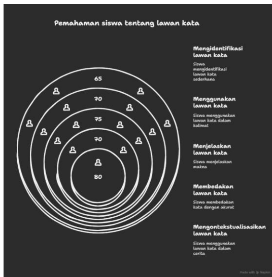
Gambar 2. Observasi Pemahaman Siswa Tentang Lawan Kata

Gambar diatas merupakan hasil dokumentasi observasi lapangan saat guru kelas 1 memberikan siswa tugas untuk mencocokkan lawan kata. Gambar tersebut menunjukkan bahwa ada beberapa siswa paham apa yang telah guru sampaikan. Namun sebagian siswa masih belum mengerti penjelasan dan materi yang telah disampaikan oleh guru. Banyak anak-anak yang tidak fokus dan tidak mendengarkan ketika guru menjelaskan. Ketidakfokusan siswa inilah yang membuat konsep pemahaman pada pelajaran bahasa indonesia di kelas 1 masih sangat rendah, kurangnya penyampaian yang efektif dari guru membuat anak-anak merasa bosan serta rendahnya ketersediaan buku paket dan cerita fabel mengakibatkan anak-anak enggan untuk membaca dan memahami pelajaran Bahasa Indonesia. Berikut ialah diagram yang menunjukkan rendahnya tingkat pemahaman konsep siswa pada pelajaran Bahasa indonesia dengan materi Lawan Kata .