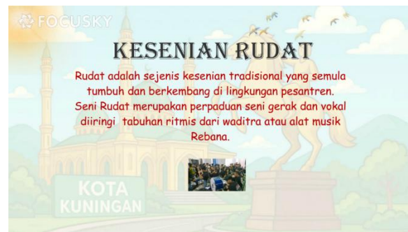
Gambar 8. Sesudah revisi

Berdasarkan masukan dari guru, Gambar 7 , menunjukkan belum adanya pengertian mengenai konten kearifan lokal, kemudian peneliti menambahkan pengertian mengenai konten kearifan lokal sesuai masukan dari guru yang ditunjukkan pada Gambar 8 .