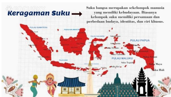
Gambar 5. Sebelum revisi

Tahapan ini merupakan tahap akhir yang dilakukan peneliti, paada tahap ini peneliti mengkaji kembali dengan melakukan penyempurnaan produk berdasarkan masukan dari guru dan siswa untuk memeperbaiki kualitas media yang telah di kembangkan. Dari siswa, muncul masukan agar warna teks direvisi karena bagian tertentu sulit dibaca akibat warna kurang sesuai dengan latar. Sementara itu, guru memberikan saran agar ditambahkan teks pengertian tentang kearifan lokal ditampilkan sebelum video diputar. Hal ini dinilai penting agar siswa memiliki pemahaman yang kuat saat menonton video sehingga pemahaman terhadap nilai-nilai kearifan lokal lebih dalam. Berikut hasil akhir media pembelajaran PowerPoint menggunakan Focusky berbasis nilai-nilai kearifan lokal yang berdasarkan masukan dari respon guru, dan peserta didik dapat dilihat pada gambar di bawah sebagai berikut: