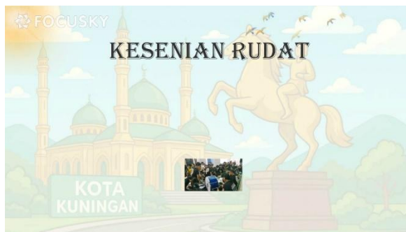
Gambar 7. Sebelum revisi

Berdasarkan masukan dari peserta didik Gambar 5 , menunjukkan warna teks yang tidak terlihat jelas ketika ditampilkan menggunakan infocus , kemudian peneliti mengubah warna teks yang semula berwarna hitam, menjadi warna hijau, sesuai yang ditunjukkan pada Gambar 6 .