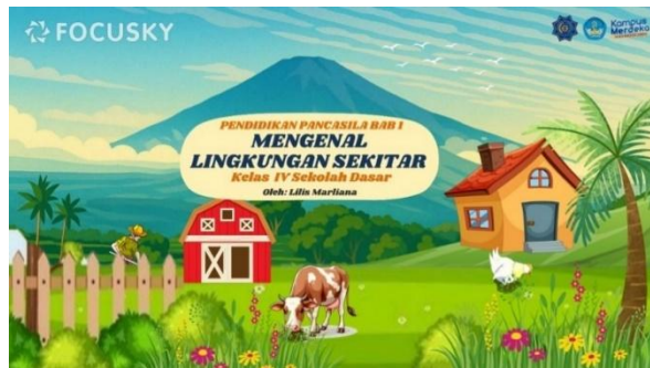
Gambar 3. Tampilan media setelah revisi

Berdasarkan saran dan komentar dari ahli media, bahwa pada Gambar 2. background yang semula tidak mencerminkan keadaan lingkungan di sekitar, kemudian peneliti merevisi pada Gambar 3. dengan merubah background yang mencerminkan keadaan lingkungan sekitar diubah dengan gunung Ciremai serta menambahkan berbagai elemen lainnya sebagai cerminan dari lingkungan sekitar yang ada di Indapatra, Kuningan Jawa Barat.