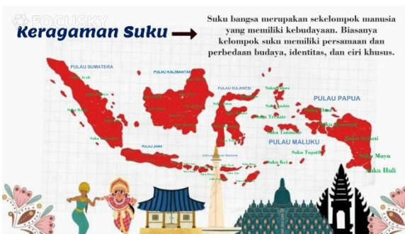
Gambar 6. Sesudah revisi