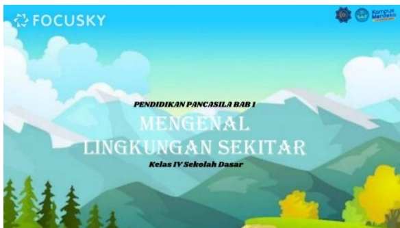
Gambar 2. Tampilan media sebelum revisi

Pada tahap ini, media pembelajaran yang telah dibuat akan divalidasi oleh ahli materi, ahli media dan ahli teknologi kemudian peneliti akan merevisi media sesuai saran dan masukan dari validator ahli sebelum media diimplementasikan. Tujuan dari validasi ini adalah untuk mengukur kelayakan produk yang telah dikembangkan untuk pelaksanaan pembelajaran. Berikut ini adalah perbaikan media pembelajaran Focusky berbasis nilai-nilai kearifan lokal sesuai saran dari ahli media: