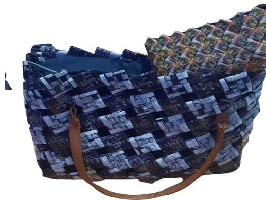
Gambar 2. Tas dan dompet dari bungkus kopi sachet

Dan satu program yang sangat dirasakan masyarakat yaitu edukasi tentang pemanfaatan limbah rumah tangga menjadi sesuatu yang bermanfaat dan bernilai ekonomis dan berdaya jual yang dapat membantu ekonomi masyarakat di bantaran sungai citarum. Edukasi yang kami berikan kepada masyarakat dalam rangka pengabdian pada masyarakat ini salah satunya dapat dilihat pada gambar di bawah ini (tas dan dompet dari bungkus kopi sachet):