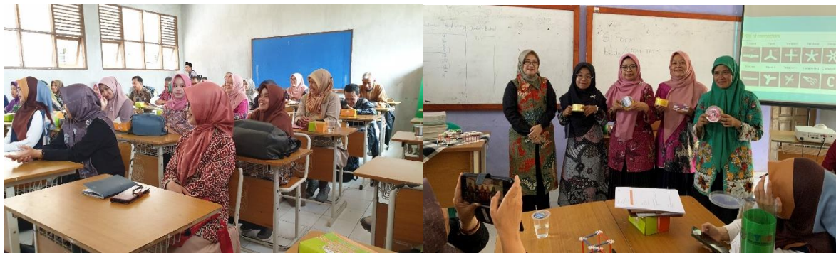
Gambar 3. Suasana Pelatihan Pembelajaran Berbasis STEM

Hasil survei menunjukkan bahwa responden mendukung penerapan pembelajaran berbasis STEM dalam konteks pendidikan sains di sekolah menengah pertama. Semua responden (100%) percaya bahwa pendekatan ini sangat penting, yang menunjukkan pemahaman akan nilai dan relevansinya dalam meningkatkan pendidikan sains. Selain itu, persepsi positif tentang keselarasan dengan kurikulum saat ini (100%) dan kesesuaian sebagai pendekatan alternatif (94%), menyoroti bahwa STEM dianggap sesuai dan relevan dengan tuntutan kurikulum saat ini. Meskipun beberapa responden (62%) merasa bahwa implementasi Pembelajaran berbasis STEM sulit dilakukan, mayoritas (82%) percaya bahwa pendekatan ini akan memberikan kontribusi positif terhadap pengembangan keterampilan abad ke-21 (4C) bagi siswa. Demikian pula, keyakinan (84%) bahwa STEM dapat meningkatkan antusiasme siswa untuk belajar menunjukkan bahwa metode pengajaran ini dapat menciptakan lingkungan belajar yang lebih menarik dan inspiratif.