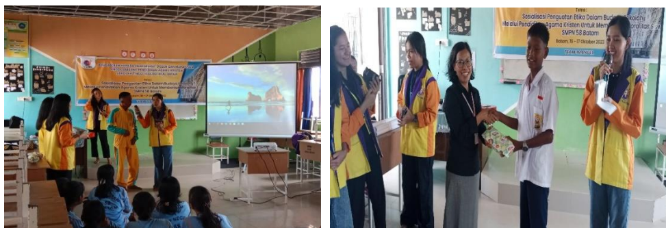
Gambar 3. Kegiatan kuis dan pemberian reward kepada peserta didik

Setelah sosialisasi dilaksanakan, kegiatan dilanjutkan dengan sesi tanya jawab serta kuis yang ditunjukkan kepada peserta didik. Kegiatan kuis tersebut disambut dengan antusias oleh peserta didik. Hal ini dilihat dari lima kuis yang diberikan semuanya dapat dijawab oleh peserta didik dan peserta didik yang menjawab kuis tersebut diberikan apresiasi berupa hadiah dari tim pengabdian.