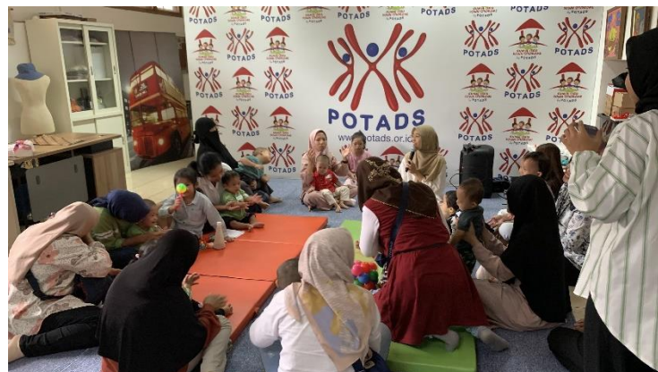
Gambar 2. Sesi Sosialisasi

Kegiatan pendampingan ini telah dilaksanakan dalam tiga sesi. Sebelum sesi pertama dimulai, orang tua mengisi daftar hadir dan pre-test untuk mengetahui parameter awal, seberapa banyak orang tua anak dengan down syndrome mengetahui tentang terapi bermain. Sesi sosialisasi dilaksanakan dengan memaparkan materi mengenai manfaat terapi bermain dalam mengoptimalkan perkembangan anak down syndrome dan jenis-jenis terapi bermain. Para orang tua memperhatikan dengan baik materi yang disampaikan. Materi disampaikan secara interaktif sehingga para orang tua bisa berdiskusi langsung lewat tanya jawab sehingga penjelasan mengenai terapi bermain lebih mudah dipahami.