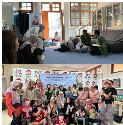
Gambar 4. Pengisian Post-Test dan Dokumentasi Bersama

Sesi terakhir dari kegiatan ini adalah evaluasi. Setelah rangkaian kegiatan selesai dilaksanakan, orang tua mengisi post-test untuk mengevaluasi sejauh mana pemahaman orang tua tentang terapi bermain untuk optimalisasi tumbuh kembang anak down syndrome yang sudah disampaikan dan dilakukan secara langsung bersama anak.