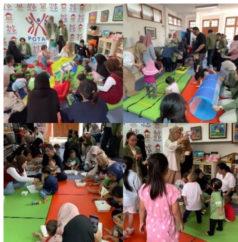
Gambar 3. Sesi Demonstrasi dan Pelaksanaan Terapi Bermain

warna dan bermain halang rintang untuk stimulasi motorik kasar maupun halus. Kegiatan bermain yang terakhir adalah membuat manusia salju dan bermain gelembung dengan tujuan stimulasi sensorik. Manusia salju dibuat menggunakan salju buatan dari garam dan gula yang dimasukkan ke dalam botol kecil menggunakan tangan anak supaya sensoriknya terstimulasi. Gelembung yang disentuh untuk dipecahkan juga menstimulasi sensorik anak.