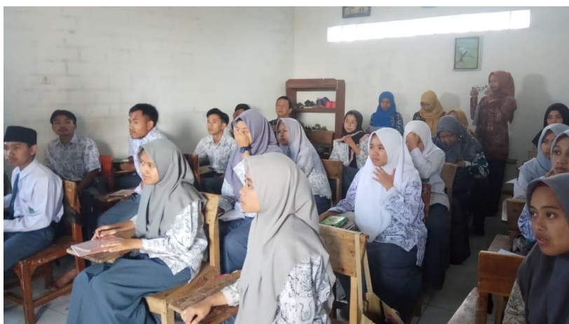
Gambar 4. Sesi Do pada siklus 1

Pada Gambar 3 dapat kita lihat pemateri sedang memimpin sesi plan dalam merencanakan perangkat pembelajaran. Setelah selesai sesi plan untuk siklus1, dilaksanakan sesi Do, Pada sesi ini dilaksanakan di Kelas XII