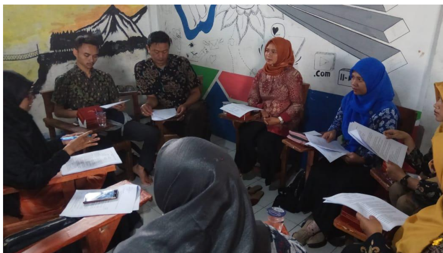
Gambar 6. Sesi Plan pada siklus 2

Pada Hari ke-2 dilaksanakan sesi Plan pada siklus 2, karena masih ada perangkat pembelajaran yang harus diperbaiki maka disepakati Lesson study dilaksanakan sebanyak 2 siklus.