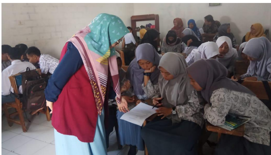
Gambar 7. Sesi Do pada Siklus 2

Pelaksanaan Sesi Plan seperti pada Gambar 6. Dengan dipimpin oleh pemateri yaitu menyusun atau merancang kembali RPP dan LKS sebagai perbaikan atas masalah yang telah dirumuskan sebelumnya.