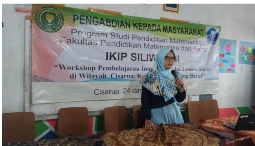
Gambar 2. Pemateri sedang Memaparkan Lesson Study

Pelaksanaan pengabdian dilaksanakan 2 hari, pada hari pertama diberikan angket awal untuk mengukur pengetahuan dan pemahaman guru mengenai Lesson Study, kemudian dilanjutkan dengan pemaparan mengenai Lesson Study secara umum. Kegiatan tersaji pada Gambar 2.