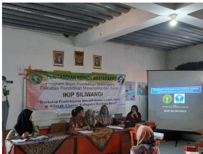
Gambar 8. Pelaksanaan Sesi See pada Siklus 2

observer untuk mengamati siswa. Setelah sesi Do selesai guru model dan observer berkumpul untuk melaksanakan sesi See.