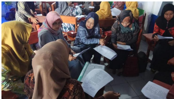
Gambar 3. Sesi Plan pada siklus 1

mendapat pengetahuan baru. Selanjutnya Dilaksanakan Sesi Plan untuk siklus 1, Sesi Plan dilaksanakan oleh pemateri dan guru-guru, pada sesi ini dilaksanakan perumusan masalah serta merancang bahan ajar yang akan digunakan, materi yang diambil adalah persamaan kuadrat pada matapelajaran matematika. disepakati bahwa untuk pelaksanaan awal sesi Do dilaksanakan oleh pemateri sebagai guru model.