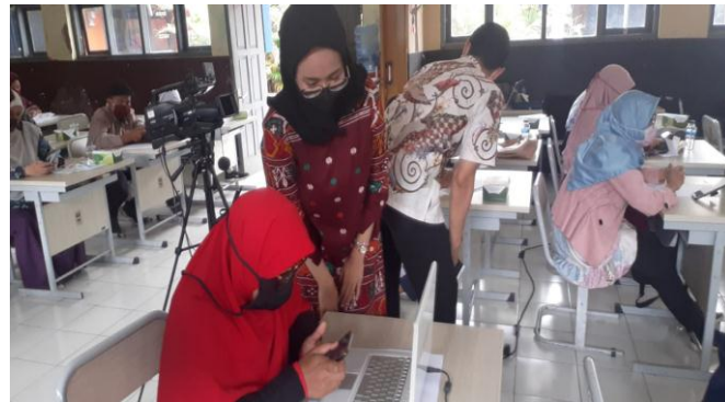
Gambar 3. Pendampingan pembuatan presentasi menggunakan Canva

Pengabdian dilaksanakan selama tiga hari kepada guru-guru Bahasa Inggris MGMP Kabupaten Bandung Barat dan bertempat di SMPN 1 Cihampelas, Kab Bandung Barat. Kegiatan di hari pertama, kurang lebih 30 peserta mengikuti presentasi tentang Canva yang disajikan oleh tim pengabdian. Presentasi berisikan informasi tentang aplikasi Canva, cara penggunaan Canva, tutorial pembuatan presentasi menggunakan Canva, dan maksimalisasi fitur Canva tidak berbayar untuk membuat presentasi bahan ajar.