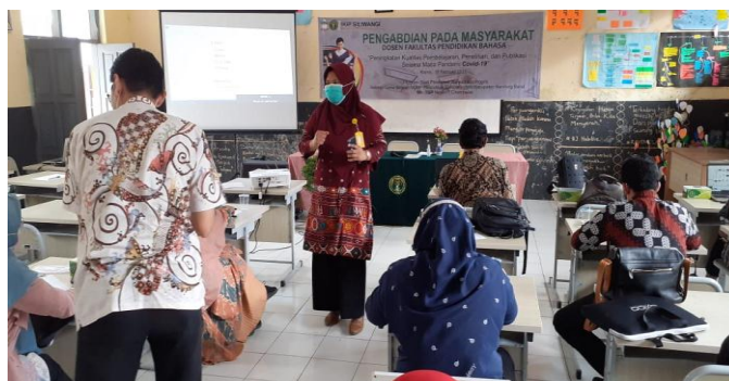
Gambar 2. Presentasi tentang penggunaan Canva

Tahap kegiatan pengabdian selanjutnya yaitu perancangan pelaksanaan pengabdian. Di tahap ini, tim pengabdian merancang kegiatan yang akan dilakukan, diantaranya presentasi yang akan ditampilkan ketika pengabdian.