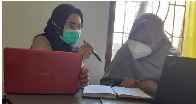
Gambar 1. Kegiatan Focus Group Discussion

dalam pembuatan bahan ajar yang menarik sehingga dapat meningkatkan motivasi siswa dalam pembelajaran daring.