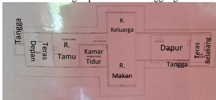
Gambar 2. Denah Rancangan Rumah Si Pitung

Peneliti : Bagaimanakah cara agar dapat membuat ragam hias pada Rumah Panggung Betawi Si Pitung menjadi simetris antara satu dengan yang lainnya?