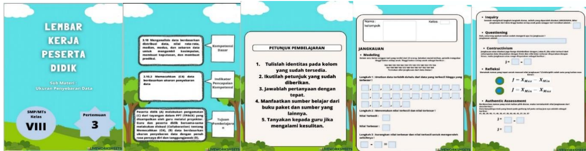
Gambar 2. Draft LKPD

terhadap langkah-langkah pada pendekatan kontekstual dan indikator-indikator kemampuan berpikir kritis siswa yang diangkat peneliti menjadi variabel terikat pada pengembangan bahan ajar berupa Lembar Kerja Peserta Didik (LKPD). Setelah itu perancangan desain dan penyusunan perangkat pembelajaran serta pemilihan media pembelajaran yang sesuai. Media pembelajaran yang disusun juga sesuai dengan tujuan pembelajaran dan manfaat pada proses pembelajaran tersebut. Berikut adalah draf bahan ajar berupa LKPD yang sudah dirancang: