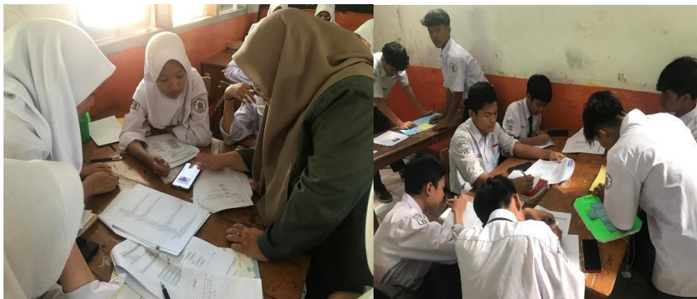
Gambar 2. Proses pembelajaran menggunakan model project based learning berbantuan geogebra

saat menggunakan model project based learning . Demikian juga dengan penelitian yang dilakukan oleh Lusiana et al., (2019); Putri et al., (2019) menyatakan bahwa model berbasis proyek ini memotivasi dan mendorong agar terlibat langsung dalam proses pembelajaran, salah satunya pada proses diskusi berani untuk menanggapi pendapat temannya sehingga proses presentasi hasil produk lebih menarik.