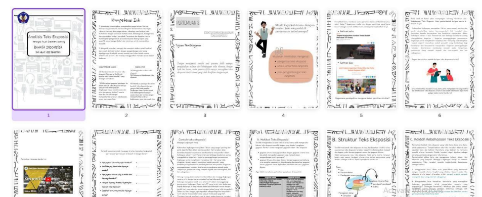
Gambar 1. Materi pada Aplikasi Canva

Penelitian dilakukan dimulai dari penyampaian materi terkait teks eksposisi yang meliputi indikator pembelajaran, definisi, stuktur, unsur, serta kaidah kebahasaan. Materi tersebut diberikan melalui sebuah handout elektronik yang dibuat menggunakan aplikasi Canva. Handout disajikan sebanyak 19 halaman dan diberi ilustrasi, video, latihan interaktif, dan halaman refleksi diri yang dapat diakses dengan bebas.