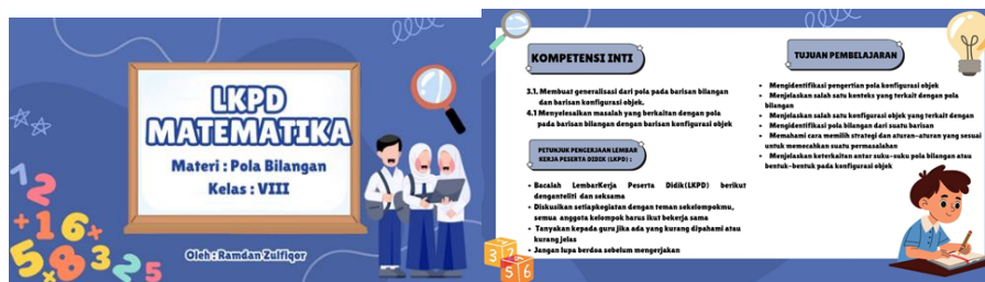
Gambar 1. Tampilan Halaman Awal dan KI, KD, TP, Petunjuk Pengerjaan

Memasuki fase perancangan ( Design ), peneliti melakukan kodifikasi ide ke dalam bentuk fisik produk. Tahap ini merupakan pilar fundamental dalam riset pengembangan, di mana kerangka LKPD mulai disusun secara sistematis dan diwujudkan berdasarkan spesifikasi yang telah ditetapkan sebelumnya. LKPD menggunakan pendekatan saintifik berbantuan PowerPoint ini dirancang dengan konsep visual modern dan edukatif yang menggabungkan unsur desain grafis digital serta nuansa pembelajaran kontekstual. Hasil desain yang dikembangkan pada LKPD menggunakan pendekatan saintifik berbantuan PowerPoint dapat digambarkan sebagai berikut: